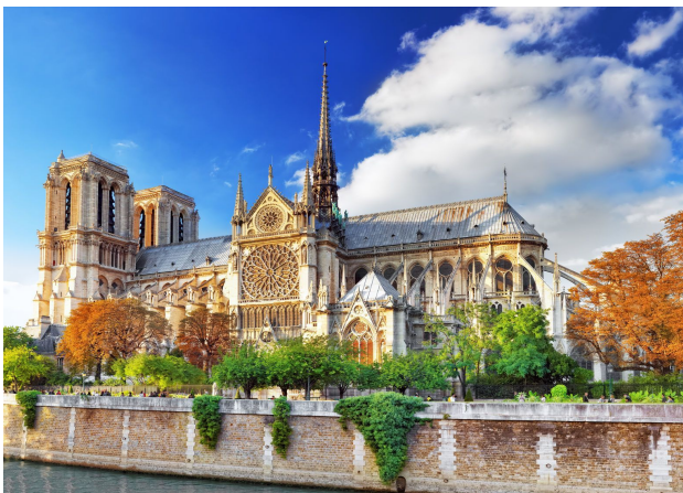
Собор Нотр-Дам, Париж