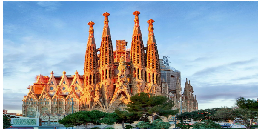
Собор Саграда Фамилия, Барселона

Задание для школьников 7-8 классов/ апробировано 11.2022, ОЦ «Взлёт», Московская область. автор: Е.Лысова-Голомзина