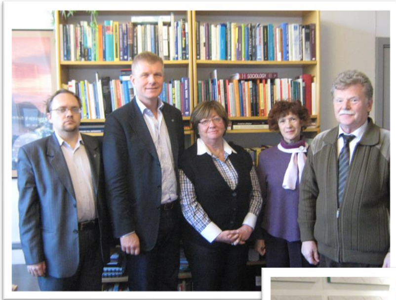
- Поездка в Швецию и Финляндию